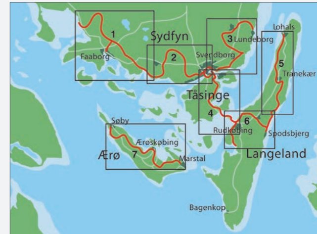
Oversigt over Øhavsstiens forløb med angivelse af de 7 folderkort, som udgives.

Layout: Bjørn Kjaer, Naturtisme mfl. Tryk: Ærø Ugeavis/Mark&Storm Grafisk. 2. udgave 2017