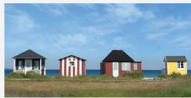
Strandhuse ved Vesterstrand.

Badehusene ligger to steder på Ærø: På Eriks Hale ved Marstal og på Vesterstrand ved Ærøskøbing. Begge steder er husene