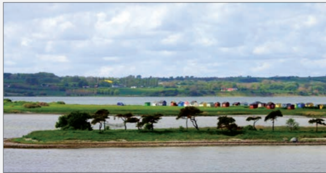
Alt er vand ved siden af Ærø...