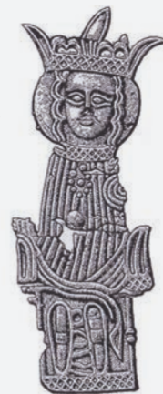
Pilgrimstegn fra Skt. Alberts Kirke

Ved Vejsnæs Nakke ses sporene af Skt. Alberts Kirke, der oprindeligt blev opført som fæstningsværk. Dateringen formodes at være vikingetid omkring år 1000. I 1300-tallet blev anlægget ændret og en kirke blev opført på stedet. Fund på stedet indikerer, at kirken var i brug frem til reformationen i 1536. Omridset af kirken er markeret med jordvolde.