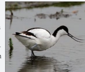
Klyden yngler på Vitsøs fugleøer.

Vitsø Nor var oprindeligt en fjordarm, men blev i 1781 tørlagt så meget, at det opståede engområde kunne afgræsses af kreaturer. I 1964 blev noret afvandet nok til at jorden kunne dyrkes som landbrugsjord. I 2009 blev søen og engområdet (i alt 112 ha) genskabt og Vitsø og vådområdet Søby Måe er i dag en vigtig lokalitet for mange trækfugle, som kan raste og yngle på de små fugleøer, der er etableret i søen. Der er anlagt en sti hele vejen rundt om Vitsø, hvorfra fuglelivet og naturen kan opleves på tæt hold.