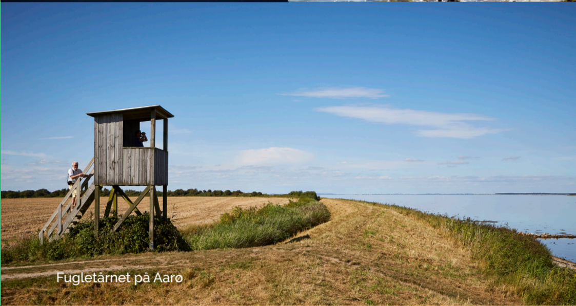
Fugletårnet på Aarø