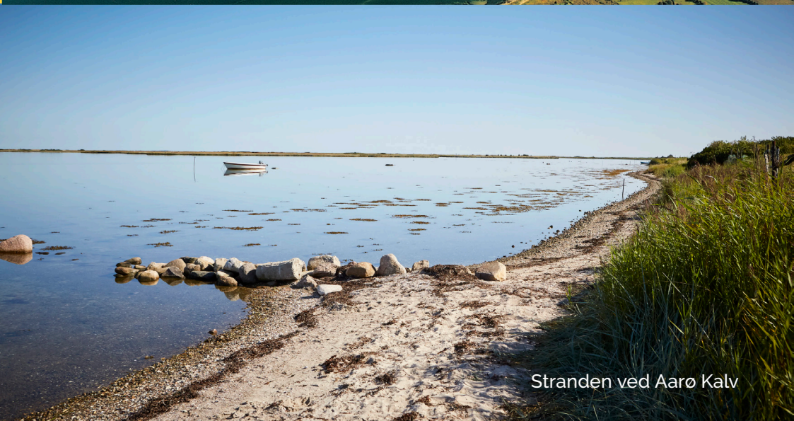
Stranden ved Aarø Kalv