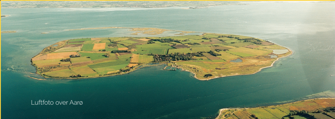
Luffoto over Aarø