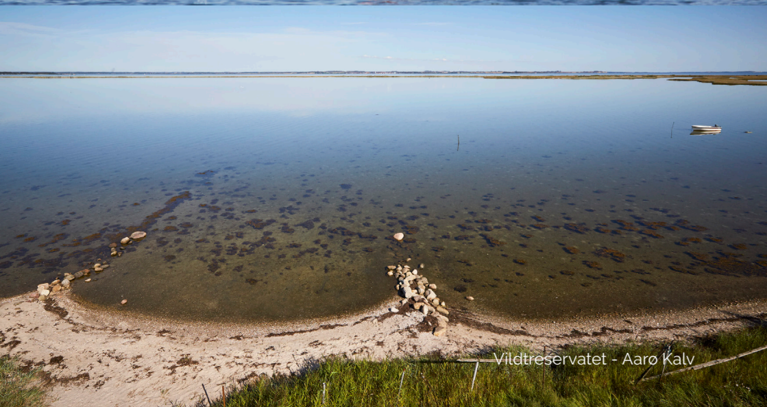
Vildtreservatet - Aarø Kalv